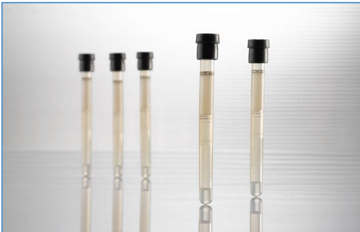
729073 4NC ESR Nátrium-citrát 3,2%-os PP 9x120 - 1.5ml töltési térfogat - csomagolva 50 db-os kiszereelésben.

További információk a következő címen érhető el: www.gbo.com/preanalytics